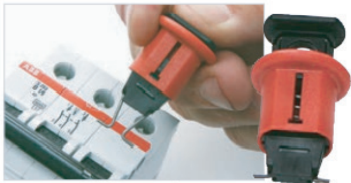
POS Pino para fora